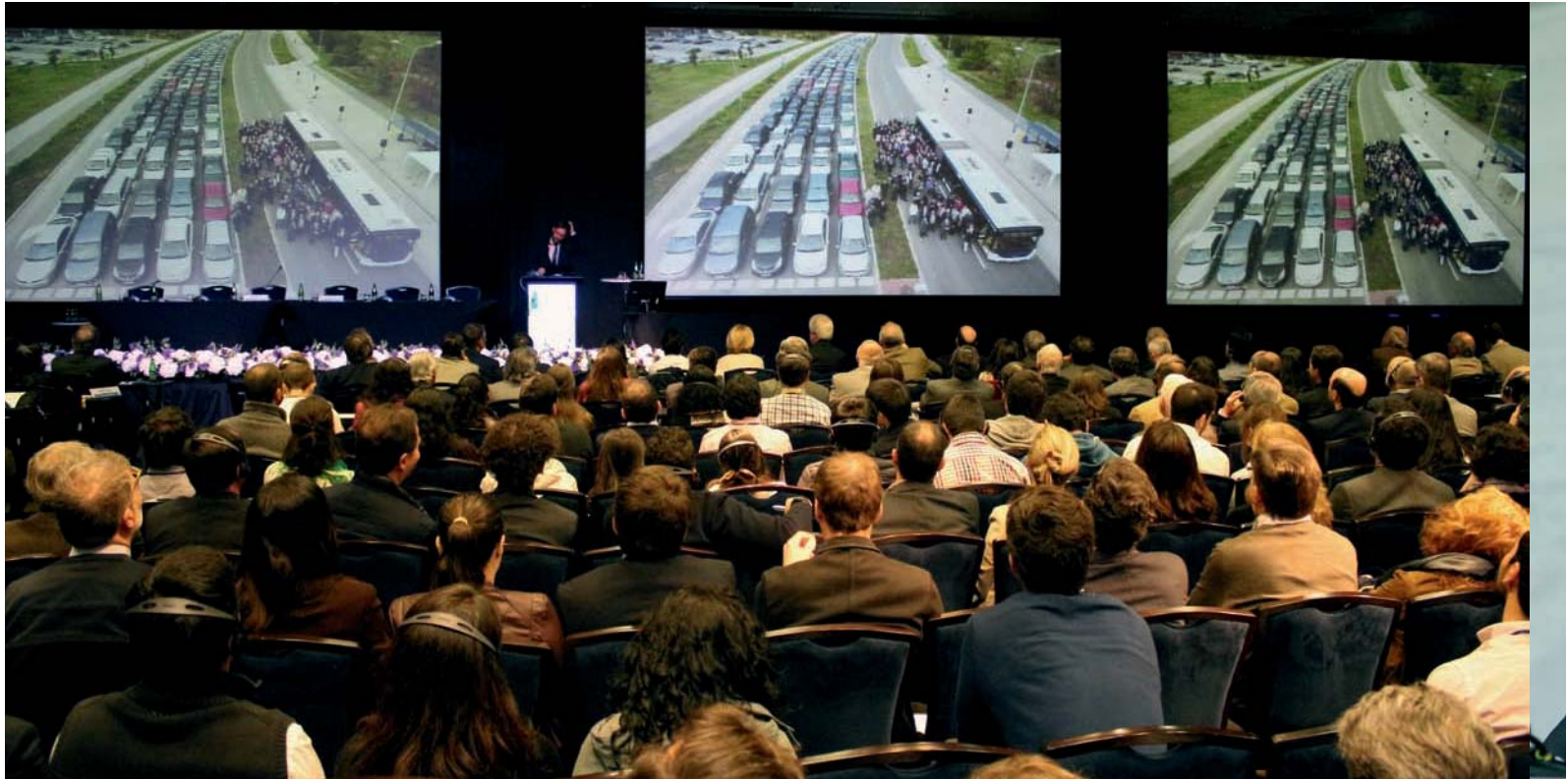
Vista general de la presentación de Philipp Rode.

Durante los últimos 14 años, explicó Burdett, esta cosmopolita ciudad ha cambiado en diversos aspectos gracias a la labor del alcalde o ‘major’, Boris Johnson, principal impulsor de las transformaciones. Con más de 8 millones de habitantes, la urbe cuenta con alta densidad. El fenómeno es relevante, ya que “la densidad no se puede ver por sí sola, sino en cómo impacta en la región. Somos un canal mundial de servicios financieros entre Tokio y Nueva York”, aclaró Burdett. El crecimiento de Londres ha sido desigual y en sólo 10 años ha aumentado en más de 1 millón de personas.