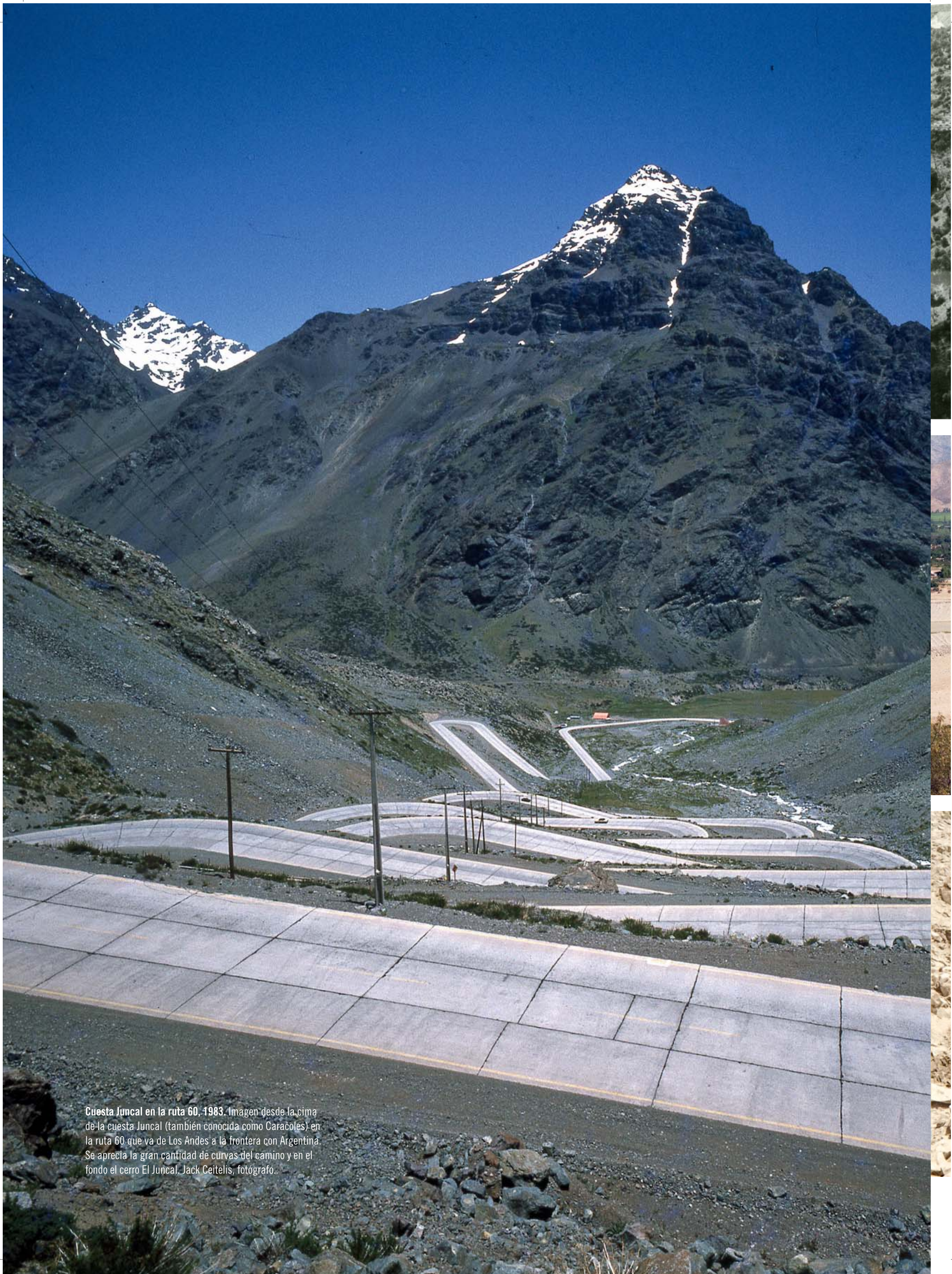
Cuesta Juncal en la ruta 60, 1983. Imagen desde la cima de la cuesta Juncal (también conocida como Caracoles) en la ruta 60 que va de Los Andes a la frontera con Argentina. Se aprecia la gran cantidad de curvas del camino y en el fondo el cerro El Juncal.