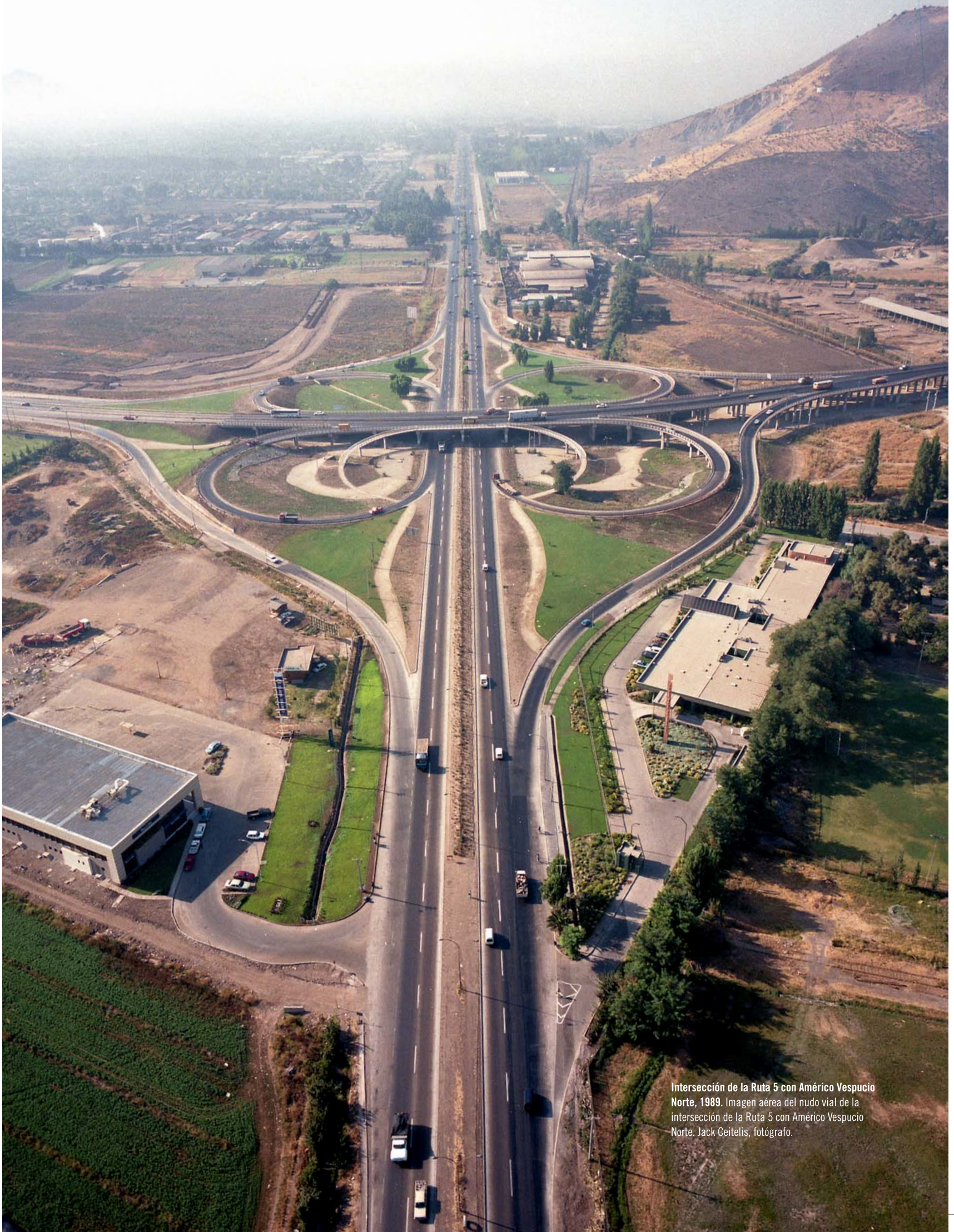
Intersección de la Ruta 5 con Américo Vespucio Norte, 1989. Imagen aérea del nudo vial de la intersección de la Ruta 5 con Américo Vespucio Norte.