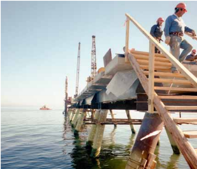
Página izquierda: Arriba izquierda, construcción del puerto de Punta Patache, 1997. Imagen general de una grúa instalando la estructura del muelle del puerto de Punta Patache, región de Tarapacá. Jack Ceitelis, fotógrafo. Abajo izquierda, desembarque de un anillo para la planta de pellets de Huasco, 1977. Imagen general de grúas y maquinaria descargando un anillo de 360 toneladas en el puerto de Huasco, para la planta de pellets de esa localidad. Jack Ceitelis, fotógrafo. Arriba derecha, Puerto de Maguillines, 1976. Imagen desde un punto de vista elevado del muelle del puerto de Maguillines, ubicado 7 km. al sur de Constitución, región del Maule. Jack Ceitelis, fotógrafo. Abajo derecha, terminal granelero en Coronel, 1991. Imagen en perspectiva de las instalaciones del terminal granelero del muelle Puchoco en Coronel, región del Bío Bío. Luis Ladrón de Guevara, fotógrafo. Página derecha: Arriba, construcción del puerto Coloso, 1984. Perspectiva del muelle del puerto Coloso, perteneciente a la Minera Escondida, en la región de Antofagasta. Jack Ceitelis, fotógrafo. Centro, construcción de puerto Coloso, 1997. Imagen del muelle y algunos de los obreros en la construcción del puerto Coloso, región de Antofagasta. Obra realizada por Sigdo Koppers. Jack Ceitelis, fotógrafo. Abajo, Muelle de pasajeros del Puerto de Antofagasta, 1916.