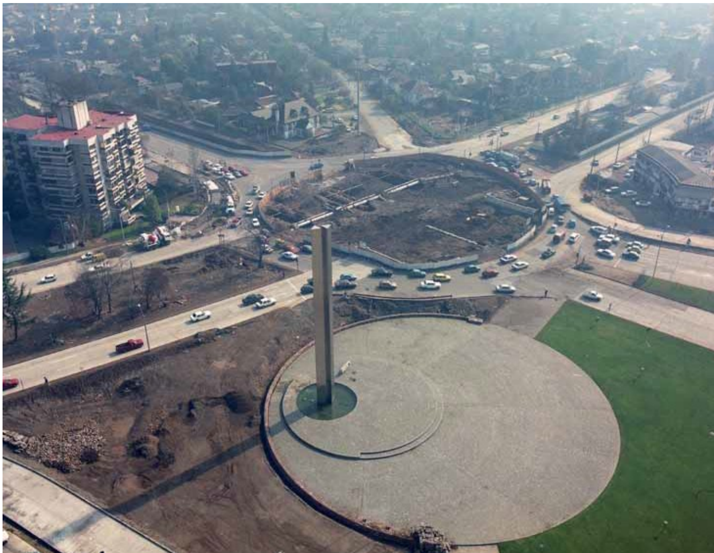
Imagen aérea de la construcción de la rotonda Kennedy, en la intersección de las avenidas Américo Vespucio, Alonso de Córdova y Presidente Kennedy en Santiago. También se aprecia el monumento al general René Schneider.

Rotonda Kennedy en Américo Vespucio, 1989.