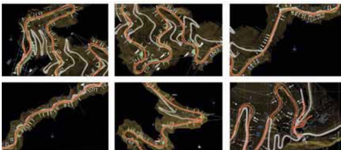
En rojo, el nuevo tramo de la ruta.

Años de descuido son los que han pesado sobre el camino que une la capital del país con la imponente cordillera. Tan solo una pista y media de ancho por la que lugareños, visitantes y trabajadores de la minería deben circular a diario de manera precaria, y en la que los accidentes no son para nada extraños. Ante esta situación, y tras casi dos décadas de proyectos de concesión infructuosos, el ministro de Obras Públicas, Laurence Golborne, junto al alcalde de Lo Barnechea, Felipe Guevara, anunciaron para 2014 el inicio de la construcción de la nueva ruta a Farellones.