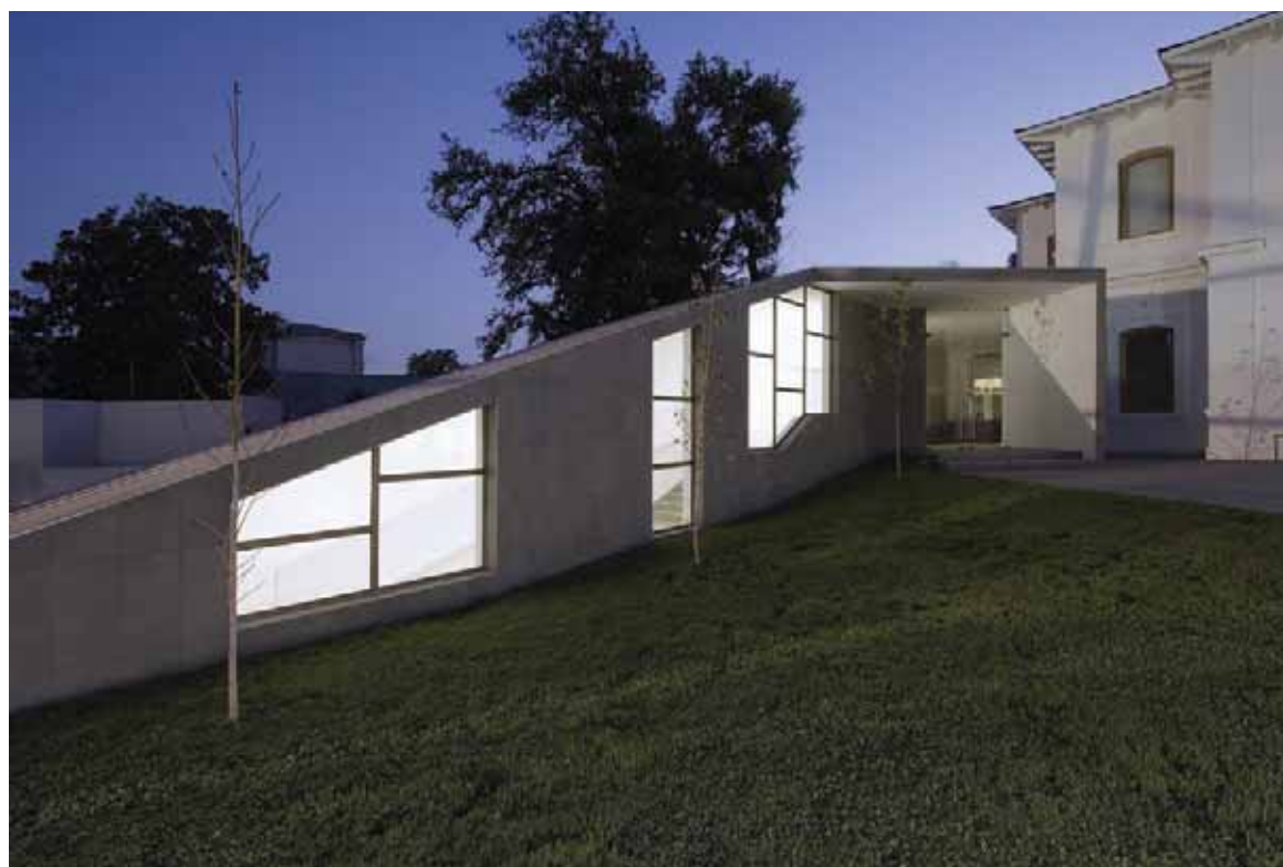
Vista exterior y lateral del teatro escuela de Carabineros.

un gran cubo de hormigón y cristal, en el cual se produce el acceso y en donde está colgado el primer helicóptero de Carabineros.