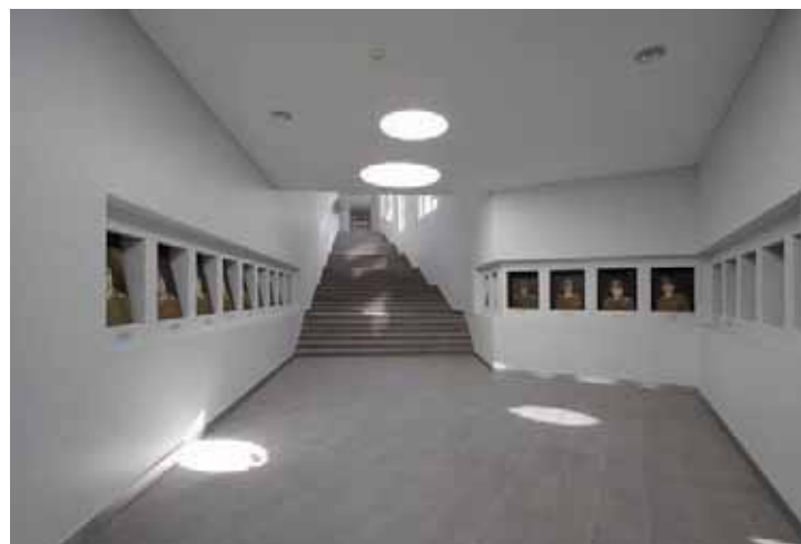
Espacios interiores del Centro Cultural, sala de exposiciones.