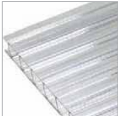
Polycarbonato Alveolar Lexan Thermoclear & Lexan Crystalite