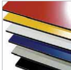
Melicbond Aluminio Compuesto Revestimiento de muros