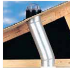
Luz Solar transferida a través de tubería