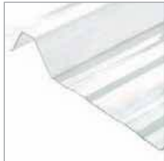
Polycarbonato compatible con techos metálicos