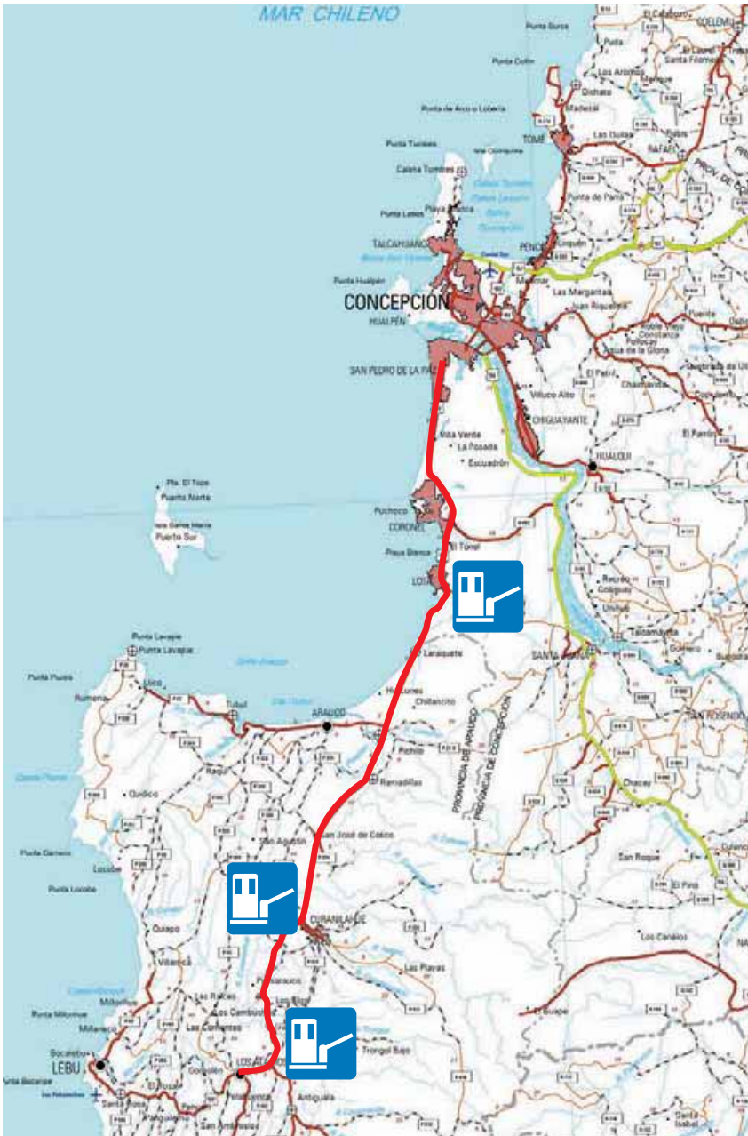
En el mapa se grafica el trazado de la Ruta 160 con los respectivos peajes que comprende el tramo: Chivilingo, Curanilahue y Pilpilco.

Además, se mejorará la accesibilidad de la población de la provincia de Arauco a los servicios de Concepción”, asegura el gerente de la concesionaria. Pero no sólo será más veloz. “Va a haber un importante aumento de la seguridad vial y peatonal”, dice Encalada. Y eso queda claro en las novedades del proyecto, el cual incluye pistas segregadas, defensas camineras, mejor geometría de la ruta, mantenencias permanentes en la vía, asistencia en la ruta las 24 horas, 92 paraderos de locomoción colectiva, 22 pasarelas peatonales y 68 citófonos de emergencia.