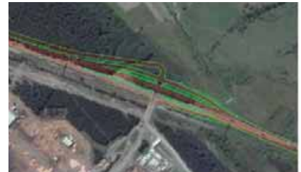
Acceso planta Horcones