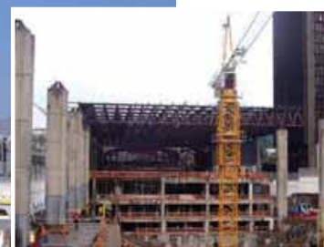
Centro Cultural Gabriela Mistral

VARMETAL con más de 20 años de experiencia en el mercado metal mecánico, está orientada al diseño, fabricación y montaje de edificios industriales, equipos de transporte, calderería liviana y pesada, elementos metálicos para el apoyo de los procesos productivos y reparación de equipos.