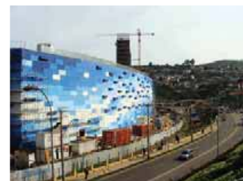
Mall Paseo Pacífico San Antonio

Siempre preocupados de entregar un mejor y más rápido servicio está constantemente integrando equipos de última generación lo que le permite una capacidad productiva mensual de 300 toneladas fabricadas en su planta de 28.000 metros cuadrados