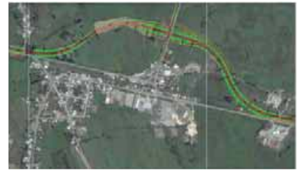
By pass Carampangue y nuevo acceso a Arauco