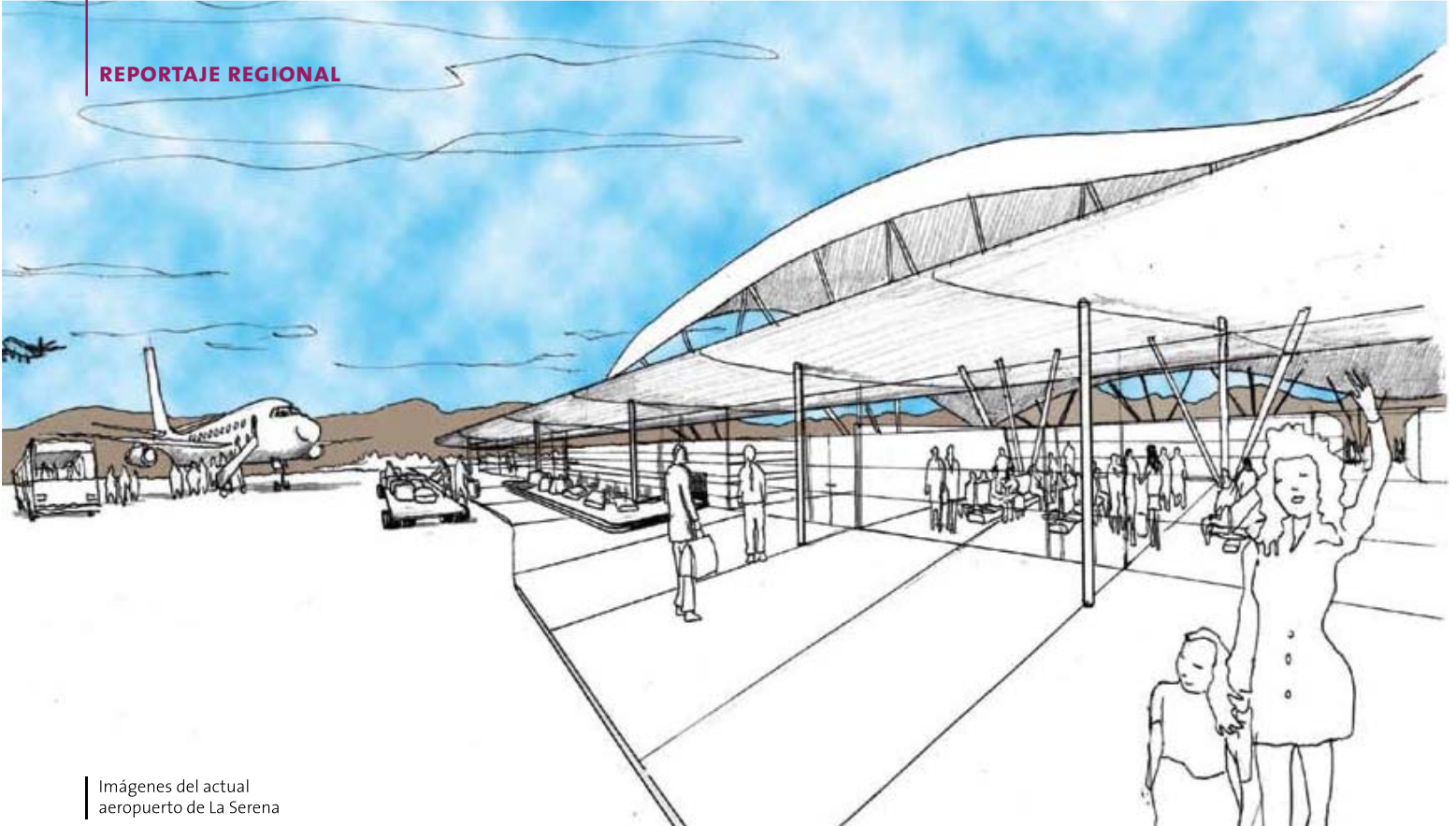
Imágenes del actual aeropuerto de La Serena