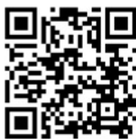
DETALLES DEL PROYECTO

En la segunda etapa, en el frente de atraque N°1 en la parte central de la explanada se conformó una viga de hormigón armado que se apoya en 16 pilotes de hormigón pre excavados de 1,50 m de diámetro.