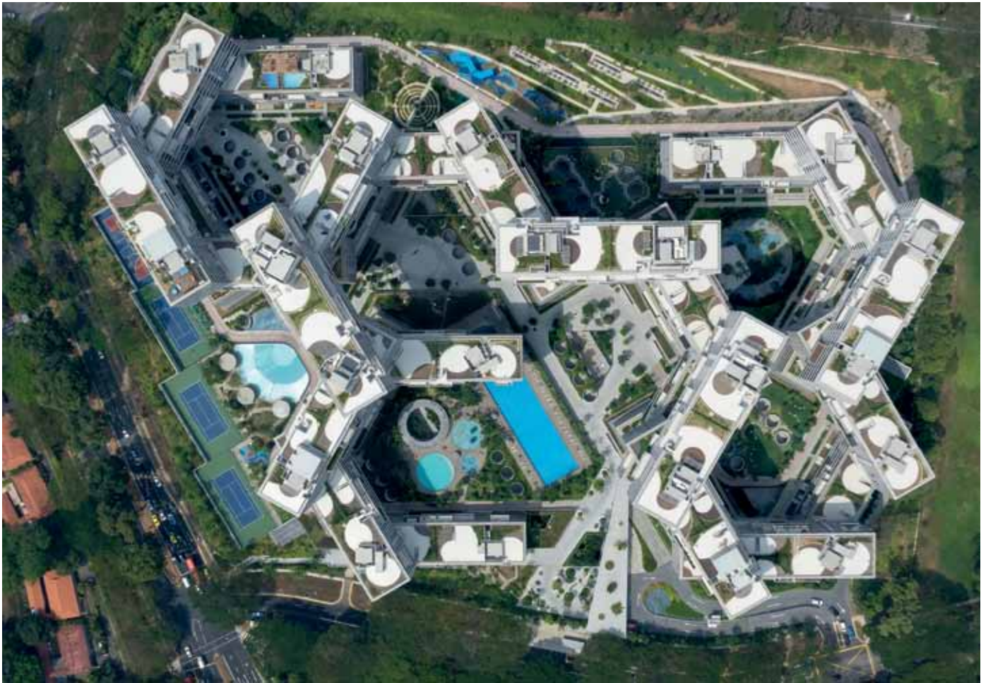
THE INTERLACE BY OMA/OLE SCHEEREN, PHOTO BY IWAN BAAAN

En vez de seguir la tipología predeterminada de una vivienda en entornos urbanos densos, el diseño convierte el aislamiento vertical en conectividad horizontal.