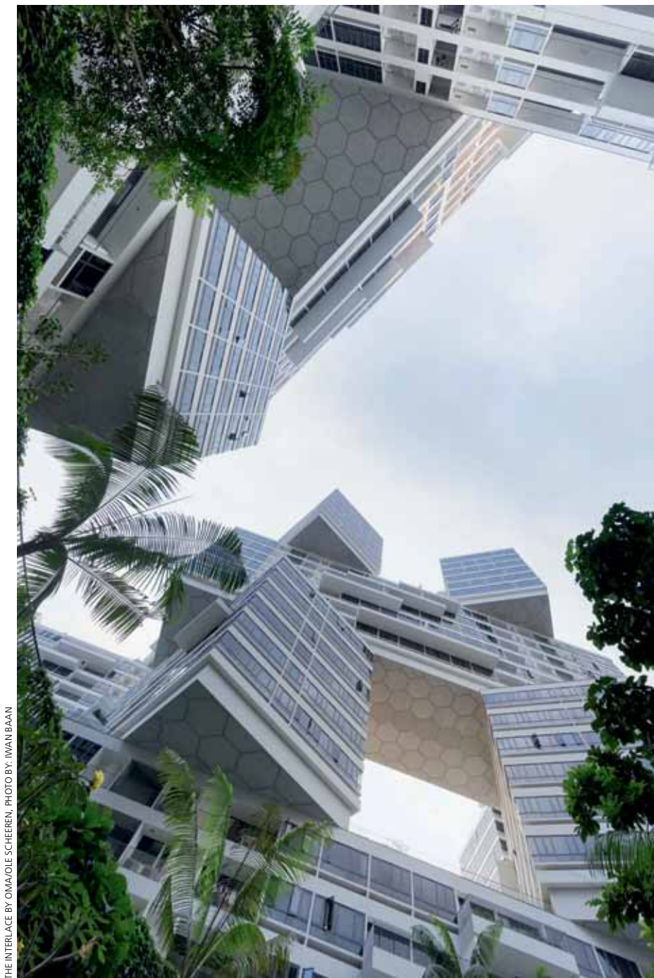
THE INTERLACE BY OMA/JOLE SCHEEREN

“La geometría inusual de los bloques hexagonales crea una estructura espacial dramática poblada por una gran variedad de áreas”, indican a Revista BiT los arquitectos responsables de OMA. Los bloques están dispuestos en cuatro principales “superniveles” con tres puntas de 24 pisos. Otras pilas de superniveles van desde 6 a 18 pisos para formar una geometría escalonada, que se asemeja más a una topografía “dramática” de un paisaje, que a la de un edificio típico. Las aberturas de