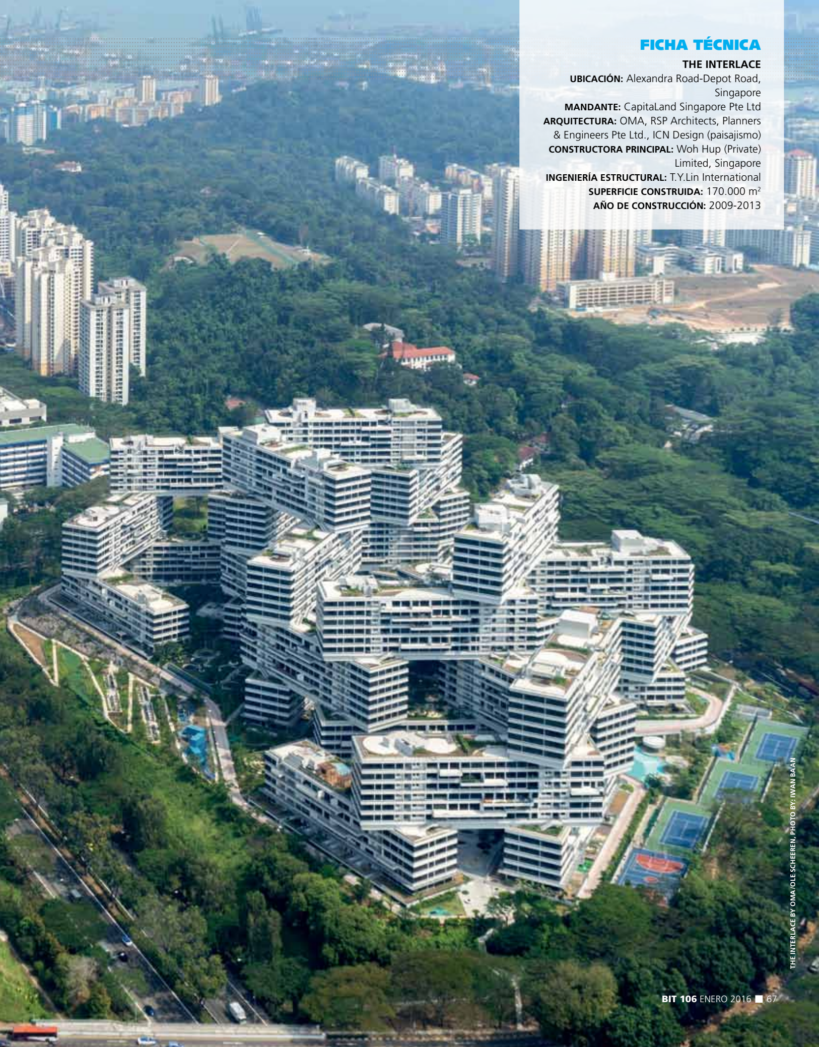
THE INTERLACE BY OMA/OLE SCHEEREN. PHOTO BY IWAN BAAN