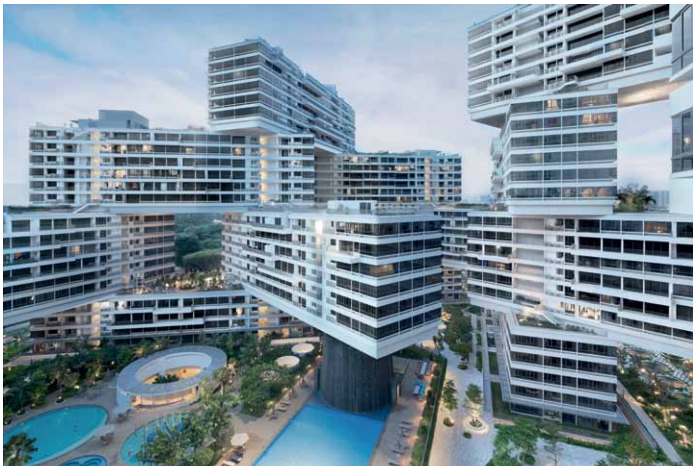
THE INTERLACE BY OMA/OLE SCHEEREN

Las terrazas sobresalen y forman un paisaje vertical en cascada a través de las fachadas. También los parques y espacios comunes abundan en el proyecto.