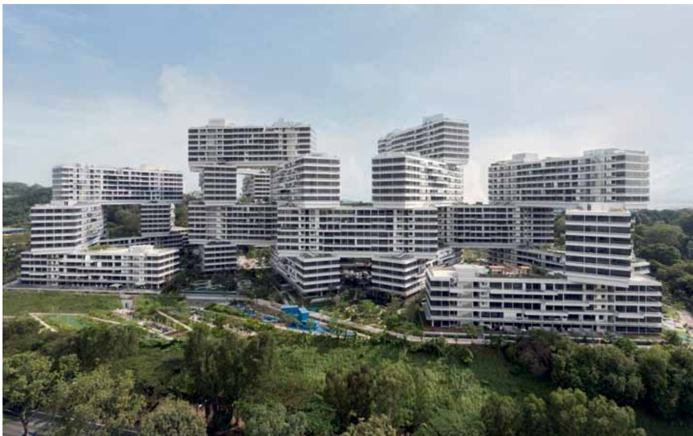
THE INTERLACE BY YOMAOLE SCHEEREN

El proyecto no solo aparece rodeado por la vegetación tropical, sino también da la impresión de que se sumerge en esta.