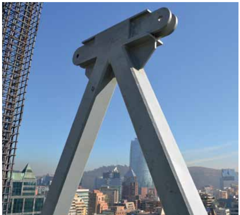
GENTILEZA ALEMPARTE BARRERA WEDELES BESANÇON ARQUITECTOS Y ASOCIADOS

El sistema de disipación de energía sísmica, consiste en 84 disipadores de energía tipo viscoso distribuidos en la altura del edificio.