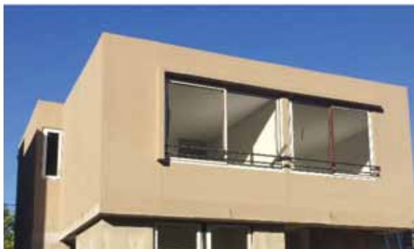
OBRA: OROCOIPO IV, CONSTRUCTORA TARGET.

El panel posee un ancho de 60 cm y un espesor variable que puede ir de 6 cm a 20 cm. El largo de las piezas es variable de acuerdo al proyecto con un máximo de 12 metros.