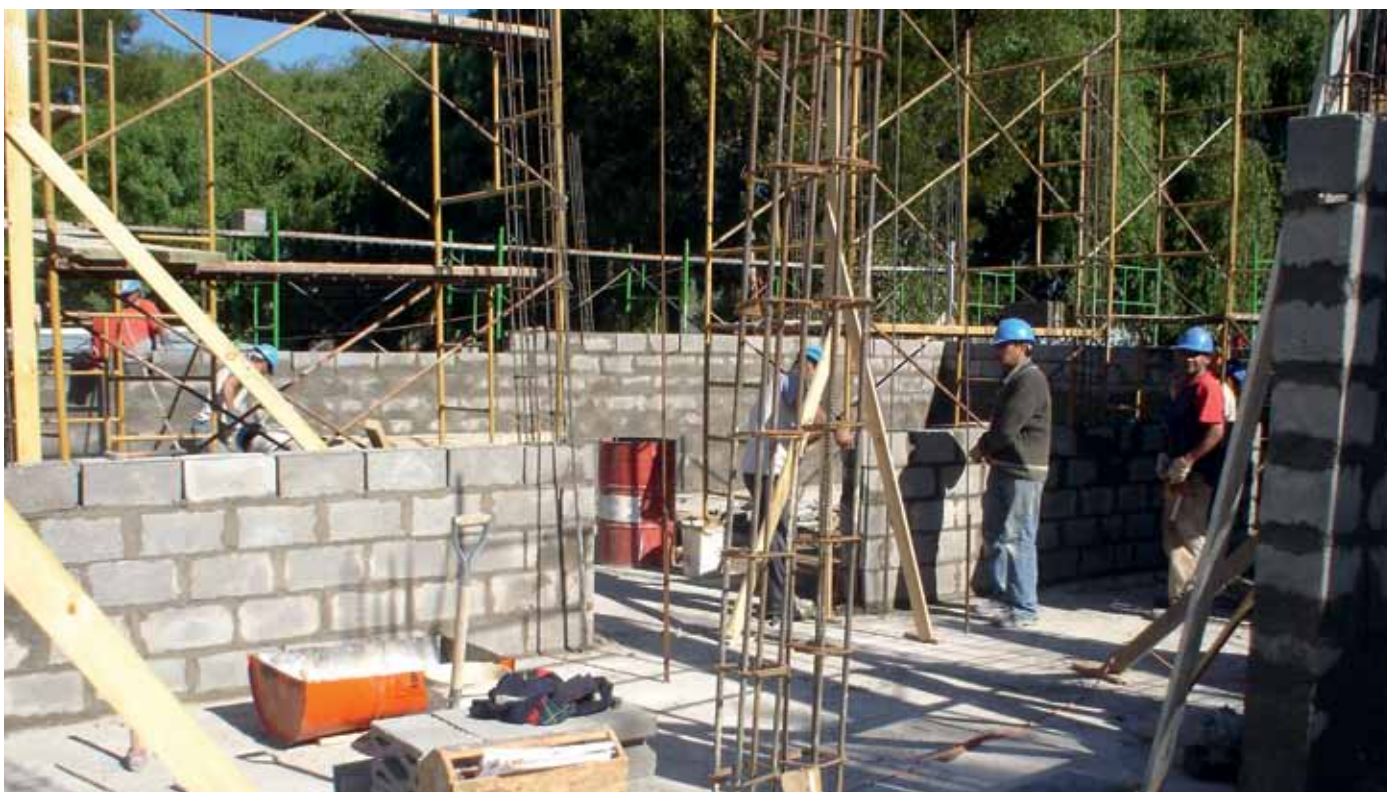
Sus muros contienen la base de la innovación tecnológica. El edificio se construyó en bloques huecos de hormigón termo-resistente.