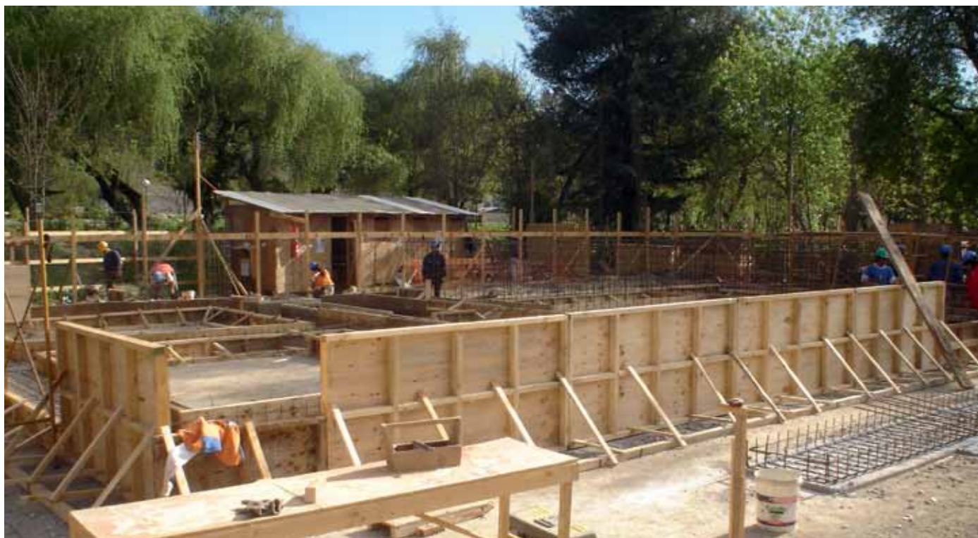
Las fundaciones son del tipo corridas en base a hormigón armado H25. Solo se generan un par de fundaciones asiladas, de la misma calidad de hormigón, para soportar los pilares de acero que sostienen los aleros de las fachadas poniente y sur.