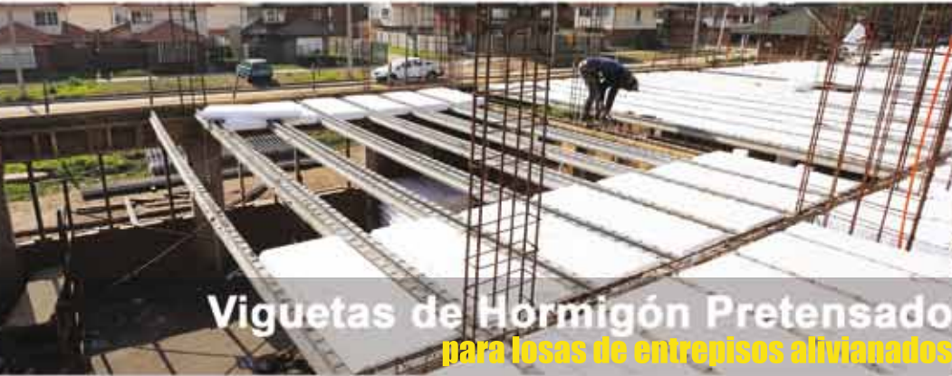
Viguetas de Hormigón Pretensado para losas de entresijos aliviados