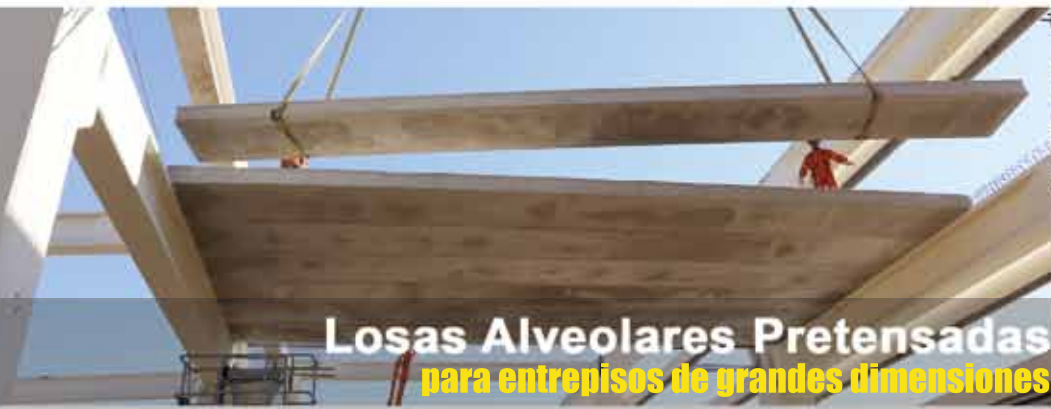
Losas Alveolares Pretensadas para entresijos de grandes dimensiones