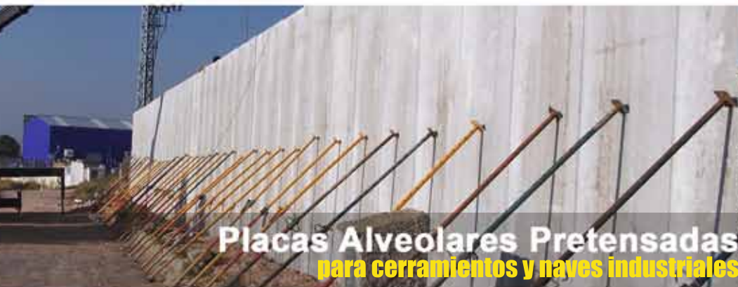
Placas Alveolares Pretensadas para cerramientos y naves industriales