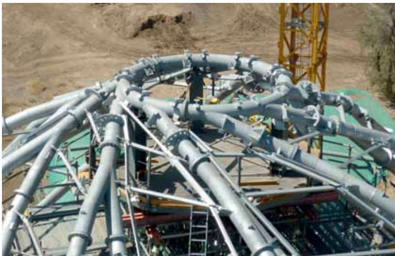
Desde el anillo salen las nueve "ramas" donde se conectan las estructuras primarias de cada pétalo.