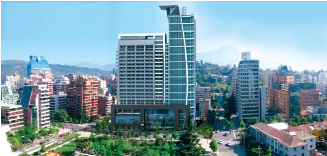
GENTILEZA INMOBILIARIA TERRITORIA

PEDRO PABLO RETAMAL P. PERIODISTA REVISTA BIT