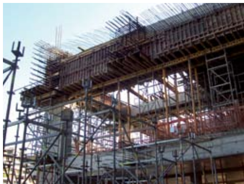
GENTILEZA RENE LAGOS Y ASOCIADOS

El gran atrio del edificio no tiene perfiles metálicos y lleva cables tensados de acero inoxidable que miden una pulgada y media, con una tensión de diez toneladas en los extremos del atrio. Esto se hizo para entregar una visión limpia a los usuarios y transeúntes.