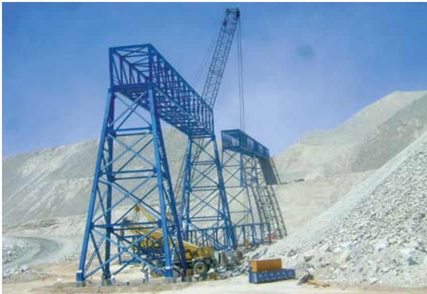
Tramo de galerías de acceso al Stock Pile. El gran impedimento en esta zona era el talud existente cercano a los 45° de pendiente, que obligó a ejecutar plataformas y rampas de acceso para posicionar y movilizar las grúas, en especial la Manitowoc 18.000.