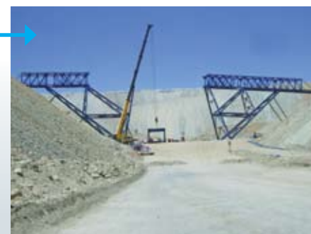
3. Una vez que la estructura queda estable, se procede a levantar la galería central.