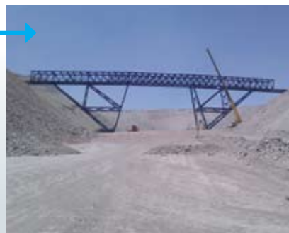
5. Atraveso terminado.