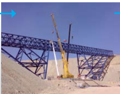
4. Conexión del tramo central y ajuste de piezas.

HUERFANOS 1160 OF 612 SANTIAGO CENTRO FONO: 6571860