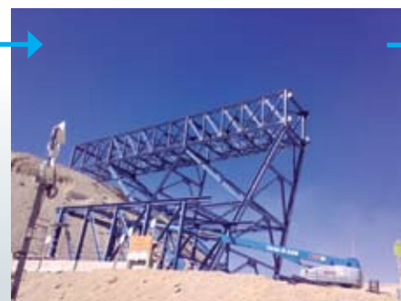
2. Atraviesos. Se montan los tramos laterales sobre el talud.

Un importante desafío fue el tendido de la cinta transportadora, en cuyo recorrido existen tres puentes llamados atraviesos.