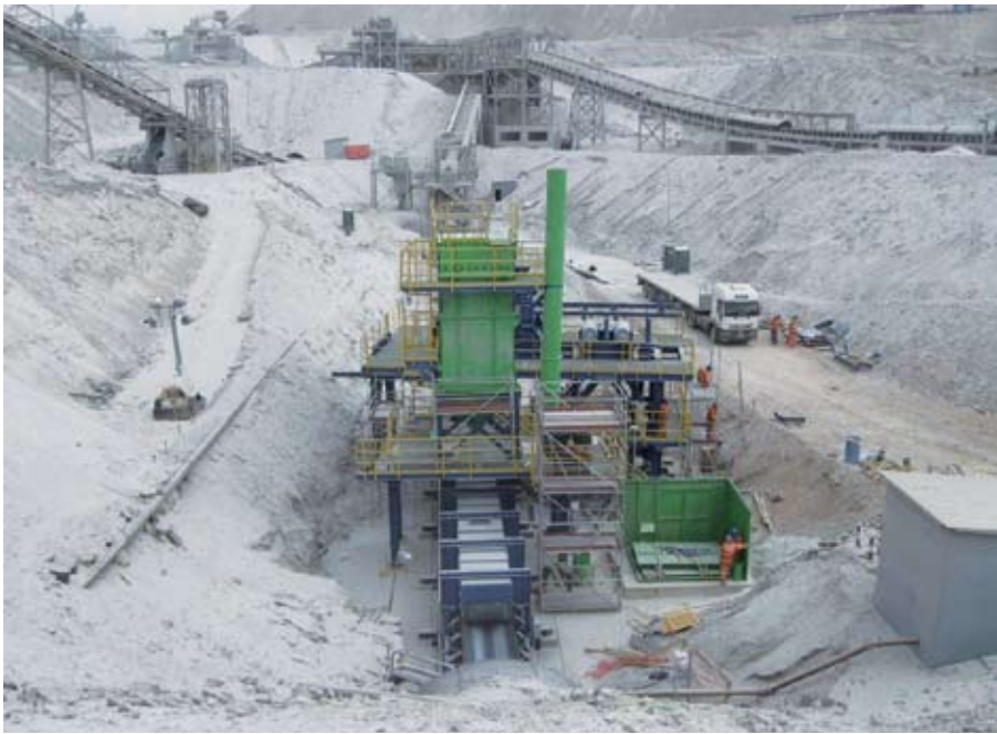
Una de las conexiones o "Tie In" a correas existentes de Chuquicamata.

nas más críticas por la logística involucrada y la conexión o "Tie In" a las instalaciones ya existentes. "El acopio de mineral grueso corresponde a un edificio de estructura metálica de cubierta tipo cónica, diseñado con perfiles de acero con revestimiento en planchas