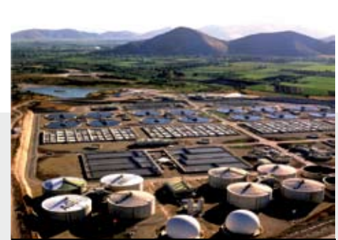
PLANTA DE TRATAMIENTO DE AGUAS SERVIDAS LA FANANA

El segundo reto. El montaje de tramos críticos de la correa como los atravesos y la llegada al Stock Pile. Dada la irregularidad del terreno, y si bien la correa en su mayoría se apoya en tierra firme, en ciertos puntos cruza atravesos de camiones y caminos. Por un lado está el rajo de RT y por