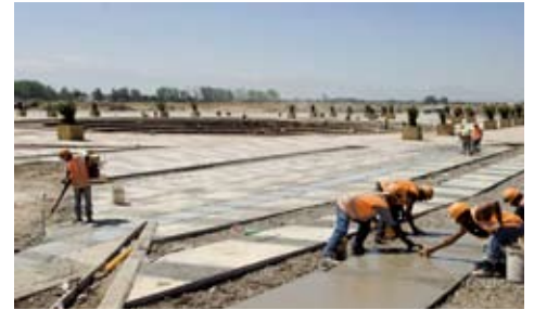
Avances del Parque Bicentenario, a mediados de diciembre del 2006.