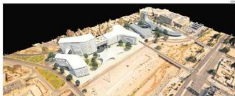
ESTE ES PARTE DEL DE SVU COIAPÓ CON LA CONCENTRACIÓN DE LOS SERVICIOS QUE INFLUYEN EN UN BUENO DESEMPEÑO.

industria de la zona y 200 veces la agrícola. En esta industria el factor es la actividad que muestra apoyo al PIB con un 1,5% de crecimiento anual en los últimos años. Por lo tanto, una estrategia de una economía productiva de materias primas con alta valor agregado y sustentable es clave. Además, la zona cuenta con una gran cantidad de recursos humanos y tecnológicos. Esto es la base para que se genere en la región de una ciudad inteligente donde se enfoca hacer una mejor comunidad, ya sea en el ámbito urbano, urbano o rural y donde los ciudadanos prosperen. Como resultado de esto se