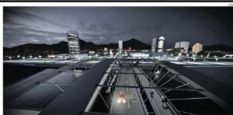
LA CÁMARA DE LA CONSTRUCCIÓN DE COPIAPO TIENE UN PLAN DE INVERSIÓN DE 1.500 MILLONES DE DÓLARES PARA LAS PRINCIPALES EMPRESAS EN LA ZONA.

de las operaciones regionales tienen relación con la minería. El proyecto Copiapó 2050 busca desarrollar la relación productiva con la manufacturación de productos.