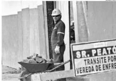
EL DESEMPEÑO EN EL RUBRO CONSTRUCCIÓN LLEGÓ EN FEBRERO HASTA ROMA.

Una de las buenas noticias en Chile en enero fue el aumento en las permisos de edificación que fueron entregados en la región. El INE en esa época informó que esta área había crecido 69,8%, es decir se había autorizado para construir 14.333 metros cuadrados más que el mes de enero de 2016. Hecho que significó más empleo y un movimiento lento, pero positivo de la economía potencialmente por la construcción, en su mayoría de obras públicas.