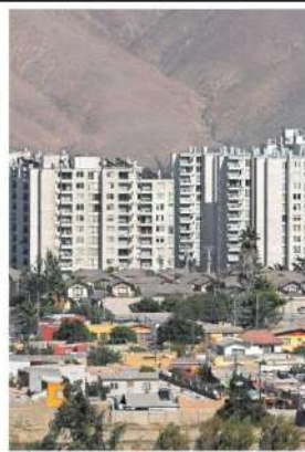
OPORTUNIDAD DE VIVIR EN EL MANEJO DE UN ESPACIO ALMACÉN DE ENTORNOS URBANOS.

COMUNA. A pesar de las inversiones que ha tenido en los últimos años, la comuna no logró repuntar en el ranking de calidad de vida urbana. Desde 2015 que su posición ha ido a la baja, contrayéndose desde esa fecha 16 puestos. Mientras Vallenar logró repuntar seis lugares en el listado.