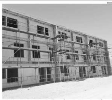
EL PROYECTO DE VIVIENDAS NUEVAS CASCA DE CHAÑARCILLO SERÁ EL PRIMERO EN ENTREGARSE ESTE AÑO.

EL DIARIO DE ATACAMA | Viernes 5 de mayo de 2017