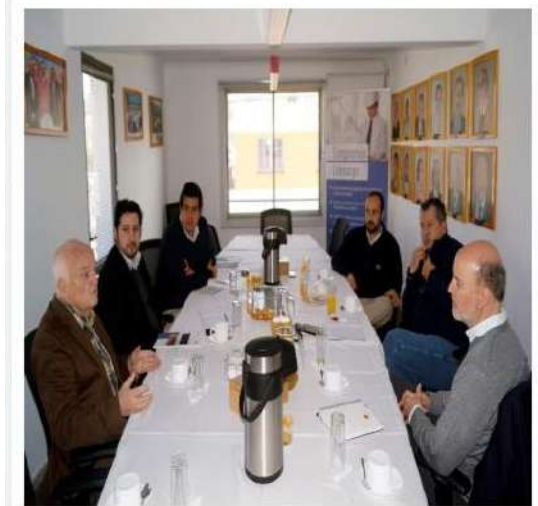
CChC Copiapó impulsa trabajo para mejorar productividad en la construcción minera

El CChC Copiapó impulsa trabajo para mejorar productividad en la construcción minera. La actividad se realizó en el marco de un taller de trabajo que se desarrolló en la sede de la entidad, con la participación de representantes de las empresas constructoras y de la propia institución. El objetivo principal fue analizar las principales problemáticas que afectan la productividad en el sector y proponer soluciones viables. Durante el taller se abordaron temas como la gestión de recursos humanos, el uso de tecnología y la optimización de procesos. Al finalizar la jornada, se acordó realizar un estudio más detallado de las problemáticas identificadas y presentar un plan de acción para abordarlas.