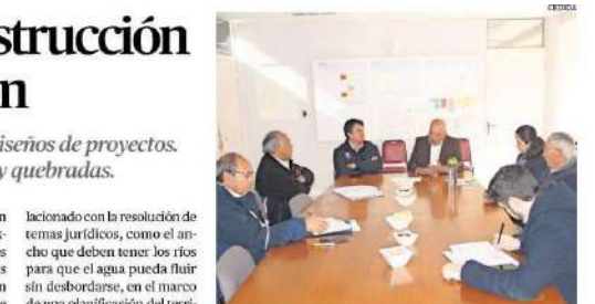
REPRESENTANTES DE AMBAS CARTERAS SE REUNIERON.

El CChC Copiapó impulsa trabajo para mejorar productividad en la construcción minera. La actividad se realizó en el marco de un taller de trabajo que se desarrolló en la sede de la entidad, con la participación de representantes de las empresas constructoras y de la propia institución. El objetivo principal fue analizar las principales problemáticas que afectan la productividad en el sector y proponer soluciones viables. Durante el taller se abordaron temas como la gestión de recursos humanos, el uso de tecnología y la optimización de procesos. Al finalizar la jornada, se acordó realizar un estudio más detallado de las problemáticas identificadas y presentar un plan de acción para abordarlas.