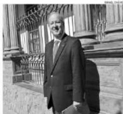
EL PRESIDENTE CULIÓ A LA BUROCRACIA POR LA DEMORA.