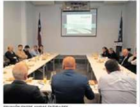
REUNIÓN ENTRE AMBAS ENTIDADES.

CChC Copiapó, explicó el impacto social y productivo que tendrá una inversión de 700 millones de dólares en la zona "pues se requiere de una significativa cantidad de personas para abordar este proyecto, que traerá un desarrollo para la región, por lo que como Cámara estamos por aportar en este desafío, ya que nuestros socios básicamente son contratistas de la industria dan oportunidad a trabajadores que son de esta zona".