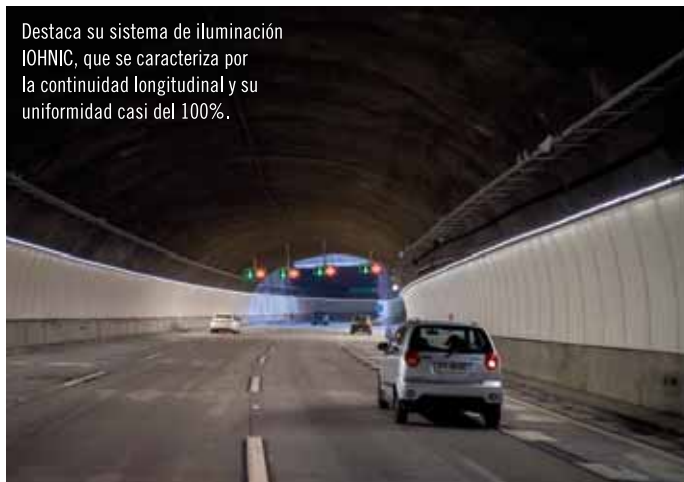
Destaca su sistema de iluminación IOHNIC, que se caracteriza por la continuidad longitudinal y su uniformidad casi del 100%.