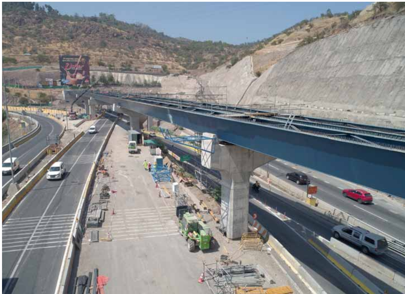
Entre otros beneficios, disminuye de 40 a 10 minutos el traslado entre un extremo y otro de la autopista.